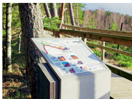
Vides dizaina objekts «Ieklausies dabā!».